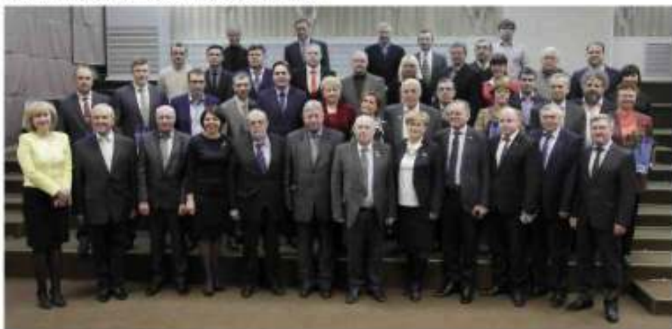
Победители организаторы конкурса «Инженер года»

Активно участвуют в конкурсах инженеры Шекинского п/о «Азот», предприятий «Тулаточмаш», «Туламашзавод», Тульского оружейного завода, заводов г. Ефремова, научные сотрудники, профессора, доценты, инженеры Тульского госуниверситета, НИ РХТУ им. Д. И. Менделеева, «НИАП-Катализатор» и другие в самых различных номинациях. Наиболее активно в конкурсах участвуют инженеры оборонного завода «Сплав». Огромную поддержку и по организации областного конкурса, и по участию инженеров этого завода в конкурсе в течение многих лет оказывает генеральный директор (ныне