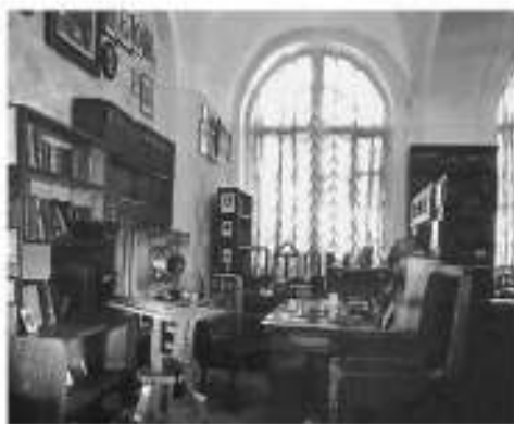
Кабинет Менделеева в Санкт-Петербургском университете

По приглашению Д. И. Менделеева студенты могли прийти на консультации, не выходя из здания университета,